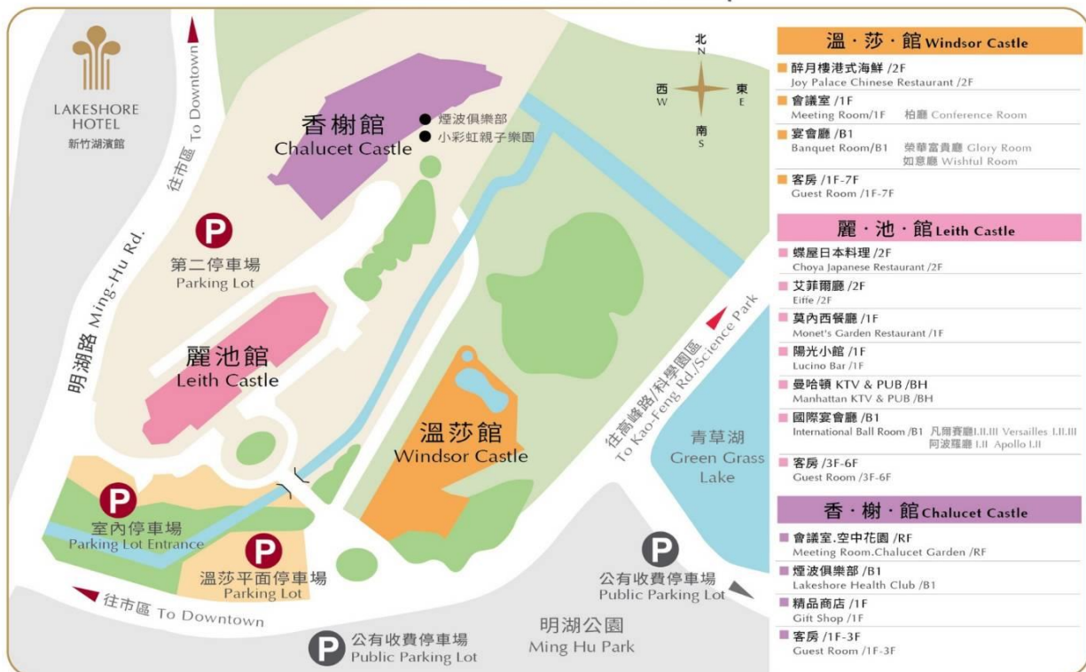
Lakeshore Hotel-Hsinchu Area Map

新竹市明湖路773號 TEL:886-3-5203181 www.lakeshore.com.tw